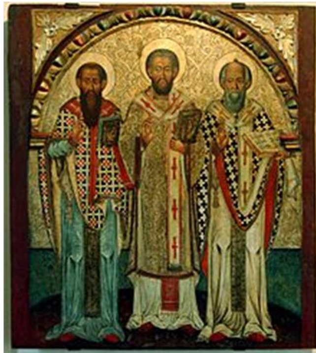
LOS TRES SANTOS JERARCAS: SAN BASILIO DE CESAREA, SAN JUAN CRISÓSTOMO Y SAN GREGORIO EL TEÓLOGO. ICONO DE LIPIE, MUSEO HISTÓRICO EN SANOK, POLONIA.

“Bien sé que, al hablar de Dios a los que le buscan, es como si quisiéramos atravesar el mar con pequeñas naves, o nos lanzáramos hacia el cielo constelado de estrellas, sostenidos por débiles alas. Porque queremos hablar de ese Dios que ni siquiera los habitantes del Cielo son capaces de honrar como conviene. Sin embargo, Tú, Espíritu de Dios, trompeta anunciadora de la verdad, estimula mi mente y mi lengua para que todos puedan gozar con su corazón inmerso en la plenitud de Dios...”