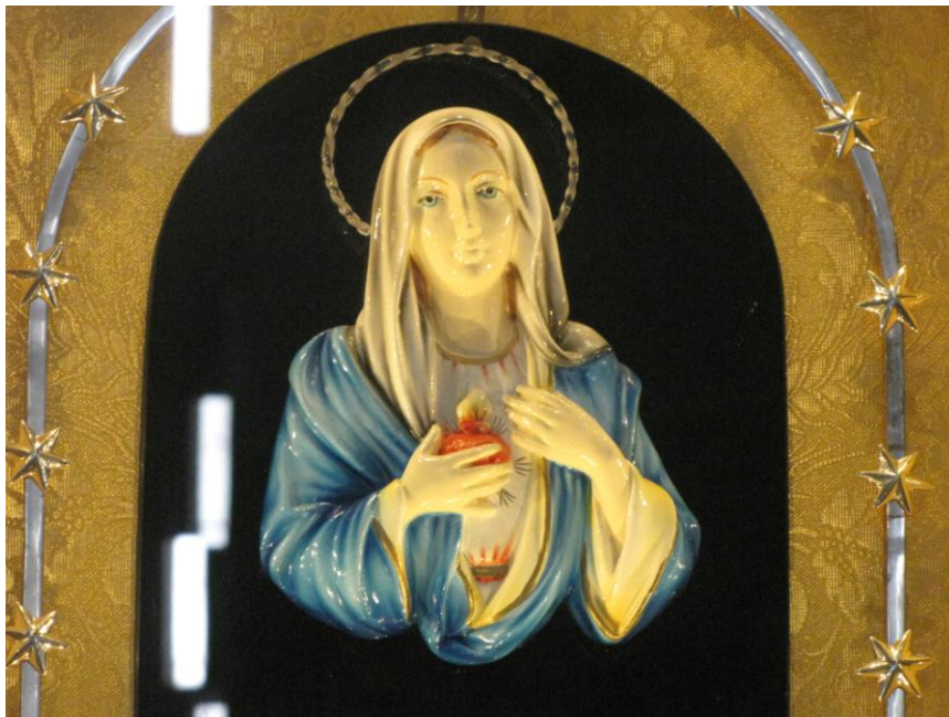
Virgen de las lágrimas en Siracusa

Entre las otras imágenes importantes de la Virgen María en Italia que lloraron (algunas sangre), podemos contar: una imagen de la Virgen de Pompeya en Gaeta, la Virgen de la Piedad de Crosia, la Virgen de las Lágrimas en Trevi, la Virgen de Giampilleri en Messina, "La Madonnina de Civitavecchia"