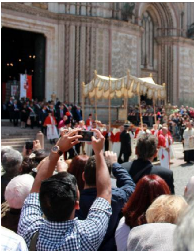
Procesión con el Corporal por la Plaza de la Catedral de Orvieto

Los hechos ocurrieron en el año 1264 ante los ojos del sacerdote Pedro de Praga, quien por entonces dudaba de la presencia real de Jesús en la Eucaristía. El presbítero, quien se hallaba peregrinando hacia Roma, descansó una noche en Bolsena, donde solicitó poder celebrar la Santa Misa, con la esperanza de encontrar una respuesta para sus dudas.