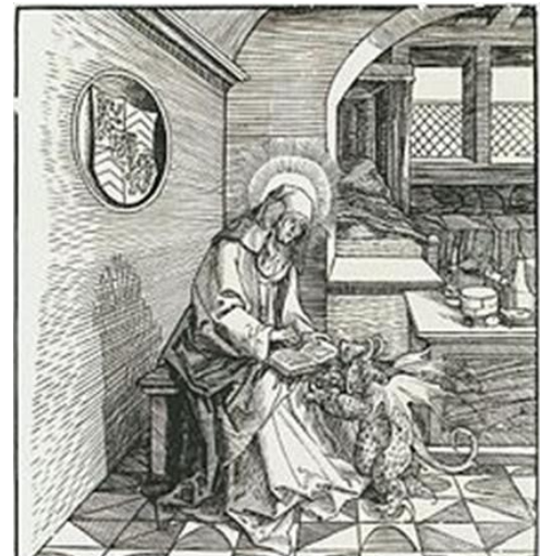
SANTA AMALBERGA DE MAUBEUGE

Amalberga de Maubeuge, fue una santa lotaringia. Según la tradición, fue hermana o sobrina de Pipino de Landen . Se casó con el conde Witger. Fue madre de San Emeberto o Aldeberto, Santa Reineldis o