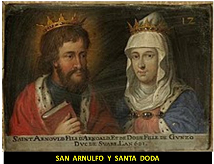
SAN ARNULFO Y SANTA DODA

Otro hijo de San Arnulfo y Santa Doda fue San Clodulfo de Metz (c.605 - 696) que en el año 656, después de la muerte de Godo, el obispo de Metz, fue elegido para ocupar la sede episcopal que antaño estuvo a cargo de su padre; cargo que tuvo durante casi cuarenta años. Como laico Clodulfo era muy virtuoso, como sacerdote y como obispo llegó a ser un modelo de pastores. Llevó una vida ejemplar, dedicada a los ejercicios de devoción y las buenas obras. Mantuvo buenas relaciones con su cuñada Gertrudis de Nivelles (626-659), hermana de Begga, mujer de su hermano Ansegisel.