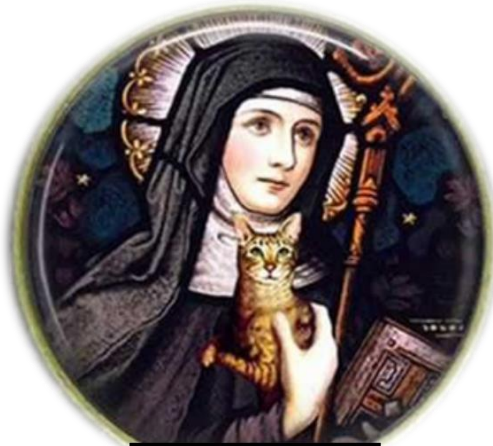
SANTA GERTRUDIS DE NIVELLES

Santa Gertrudis (626 - 659) fue educada muy esmeradamente por sus padres Pipino e Ita, quienes pronto descubrieron su inclinación por la vida religiosa. Cuando tenía cerca de 10 años, su padre dio una fiesta a la que asistió el rey Dagoberto y los nobles más prominentes de Austrasia. Uno de los nobles pidió al rey que le otorgara la mano de Gertrudis para uno de sus hijos ahí presentes. Dagoberto, pensando halagar a la niña, la mandó llamar y señalando hacia el apuesto joven le preguntó si deseaba casarse con él. Para sorpresa suya, Gertrudis le contestó que ella nunca tomaría esposo y que deseaba tener a Cristo Jesús por su único amo y Señor. Nadie se opuso a la determinación de la niña, antes bien fue elogiada por el rey y los cortesanos.