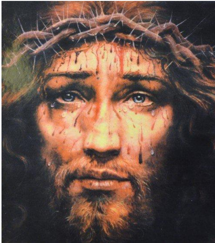
Devoción a la Sangre Preciosa.