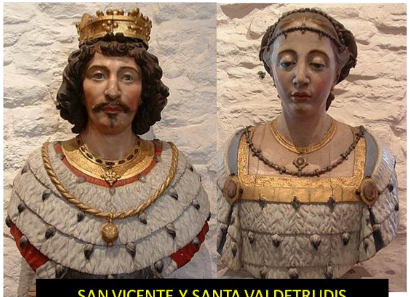
SAN VICENTE Y SANTA VALDETRUDIS

Romano, donde permanece hasta hoy en la fecha del 9 de abril. Es la patrona de Mons, ciudad que también custodia sus reliquias, en una iglesia del siglo XV, construida cerca del auténtico Chateaulieu o Castrólico.