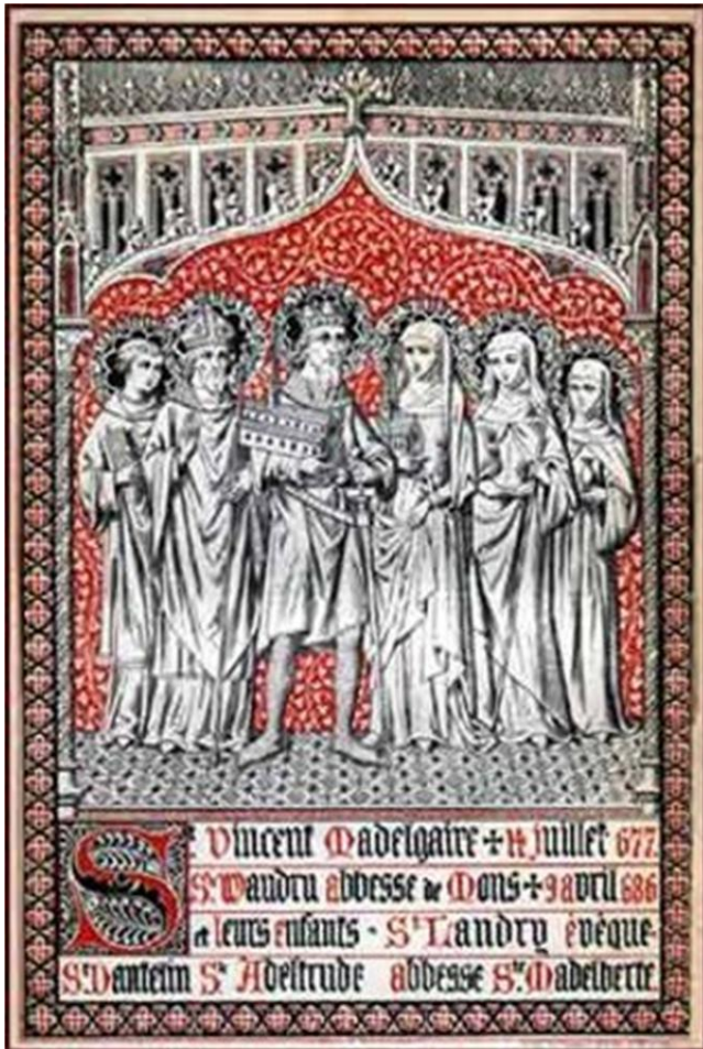
SAN VICENTE Y SANTA VALDETRUDIS PADRES SAN LANDERICO, SAN DENTELINO, SANTA ALDETRUDIS Y SANTA MADELBERTA HIJOS

http://es.catholic.net/op/articulos/36750/cat/214/alde-trudis-santa.html#modal http://www.santiebeati.it/dettaglio/69520 https://hagiopedia.blogspot.com/2014/04/santa-wadeltrudis-m-c-688.html https://books.google.com.mx/books?id=NorWcpGbjYIC&pg=PA245&lpg=PA245&dq=san+madelberta&source=bl&ots=P Dsz45PCDk&sig=ACfU3U3Owzoqsp4sC8dmGg0mwreljZEhLQ&hl=es&sa=X&ved=2ahUKEwi5rofg_P4AhX4EEQIHU3-BbIQ6AF6BAgTEAM#v=onepage&q=san%20madelberta&f=false https://www.britishmuseum.org/collection/term/BIOG143367 http://www.omniumsanctorumhiberniae.com/2014/09/saint-madelberta-of-maubeuge-september-7.html?m=1 https://hagiopedia.blogspot.com/2013/01/santa-aldegunda-de-maubeuge-630-684.html