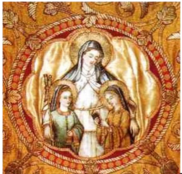
STA. VALDETRUDIS Y SUS HIJAS. DETALLE DE UN ESTANDARTE BORDADO

La Vita Madelbertae está ligada al ciclo de las abadesas de Maubeuge: adaptándoles la Vitae de la salpi de Hainaut y vinculándolas a la familia carolingia, los biógrafos esperaban glorificar a sus heroínas.