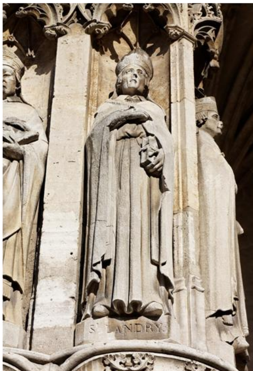
SAN LANDERICO IGLESIA DE SAINT-GERMAIN L'AUXERROIS EN PARIS.

El Obispo Landerico , mostró con su vida el más claro ejemplo de amor a los necesitados, fue durante los tiempos de hambruna que vendió todas sus pertenencias para comprar pan y distribuirlo con los pobres y los hambrientos.