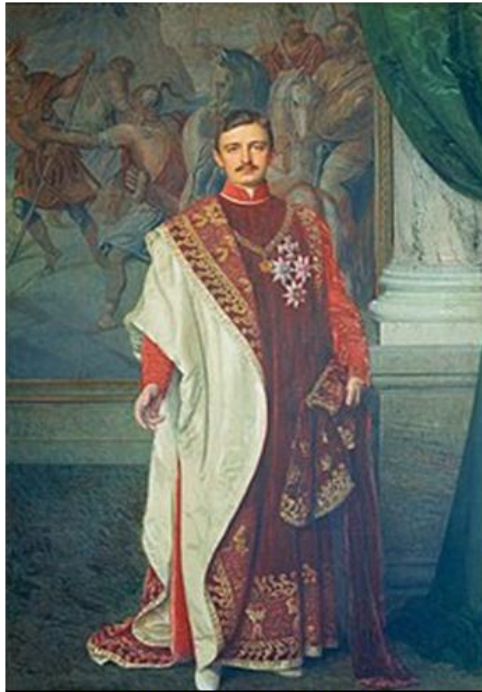
CARLOS I DE AUSTRIA CON EL HÁBITO DE LA ORDEN DEL TOISÓN DE ORO

El deber más sagrado de un rey - el compromiso por la paz - Carlos lo puso al centro de sus preocupaciones a lo largo de la terrible guerra. Fue el único, entre los responsables políticos, que apoyó los esfuerzos por la paz de Benedicto XV.