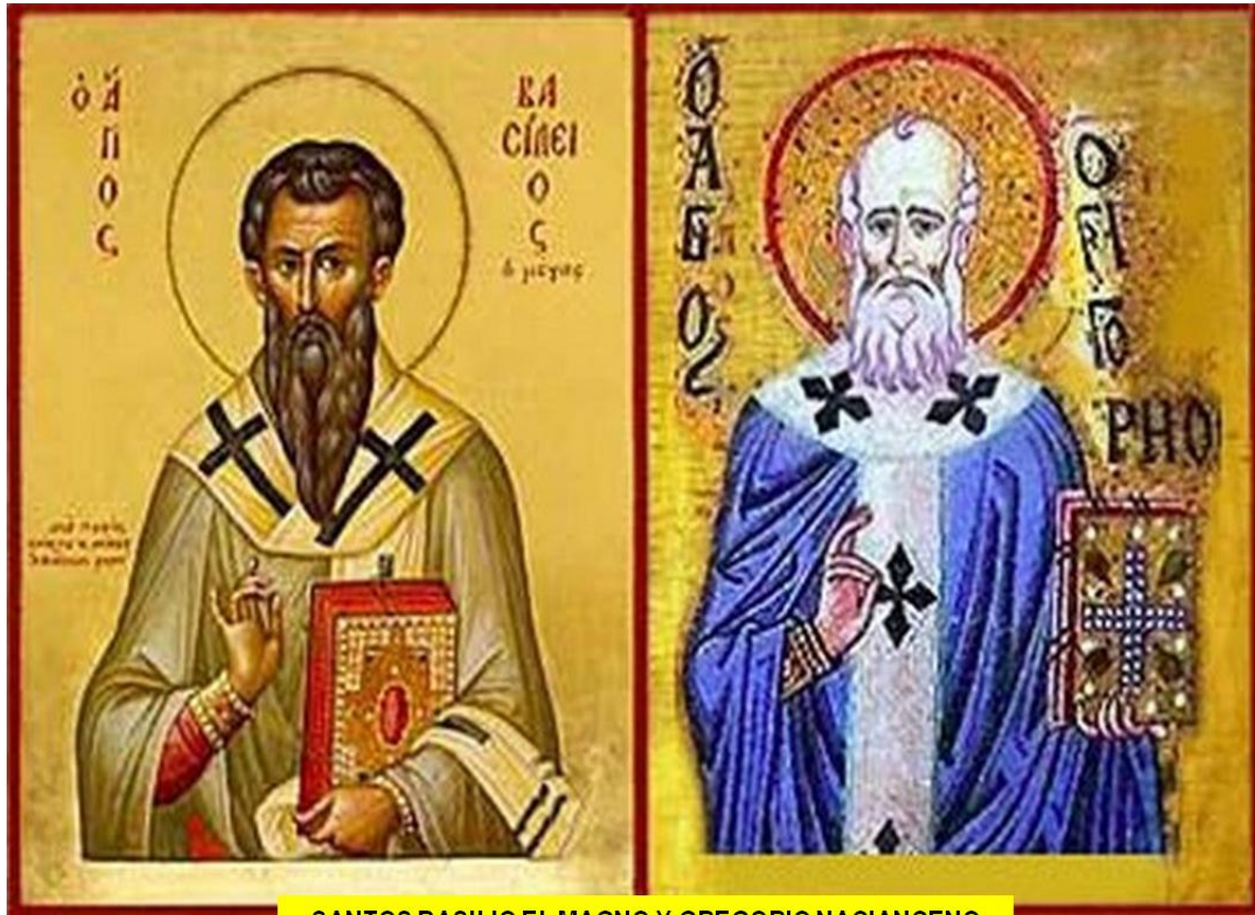
SANTOS BASILIO EL MAGNO Y GREGORIO NACIANCENO

Enseñanza y escritos de Gregorio: 45 discursos, 244 cartas y 400 o más poemas.