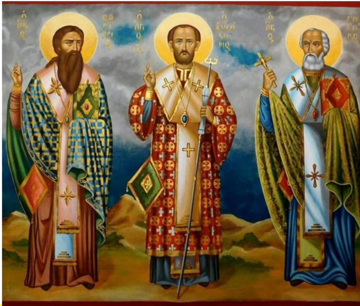
Basilio el Grande, Gregorio el teólogo y Juan Crisóstomo

En el año 357, cuando regresa a su hogar, Gregorio recibió el bautismo y se orientó hacia la vida monástica: la soledad, la meditación filosófica y espiritual, le fascinaban, por lo que se dirige al Ponto con su amigo Basilio. Él mismo escribirá: “Nada me parece más grande que esto: hacer callar los propios sentidos, salir de la carne del mundo, recogerse en uno mismo, dejar de ocuparse de las cosas humanas, excepto de las estrictamente necesarias, hablar consigo mismo y con Dios, llevar una vida que trasciende las cosas visibles; llevar en el alma imágenes divinas siempre puras, sin mezcla de firmas terrenas y erróneas, ser verdaderamente un espejo immaculado de Dios y de las cosas divinas, y serlo cada vez más, tomando luz de la luz...; gozar, en la esperanza presente, el bien futuro, y conversar con los ángeles; haber abandonado ya la tierra, aún estando en la tierra, transportados a lo alto con el espíritu.” («Oratio 2», 7)