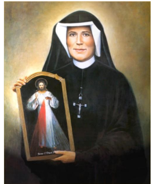
santa Faustina Kowalska

Algo presentían que había pasado aquella noche. Fue San Ezequiel Moreno quien lograría ir descubriendo ese misterio. Porque Jesús se le había aparecido a la Madre.