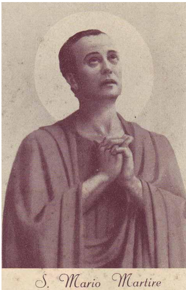
S. Mario Martire

En el lugar del martirio, en la finca de Boccea, se construyó una iglesia, cuyas ruinas aún son visibles y que fue un lugar de peregrinaje durante la Edad Media.