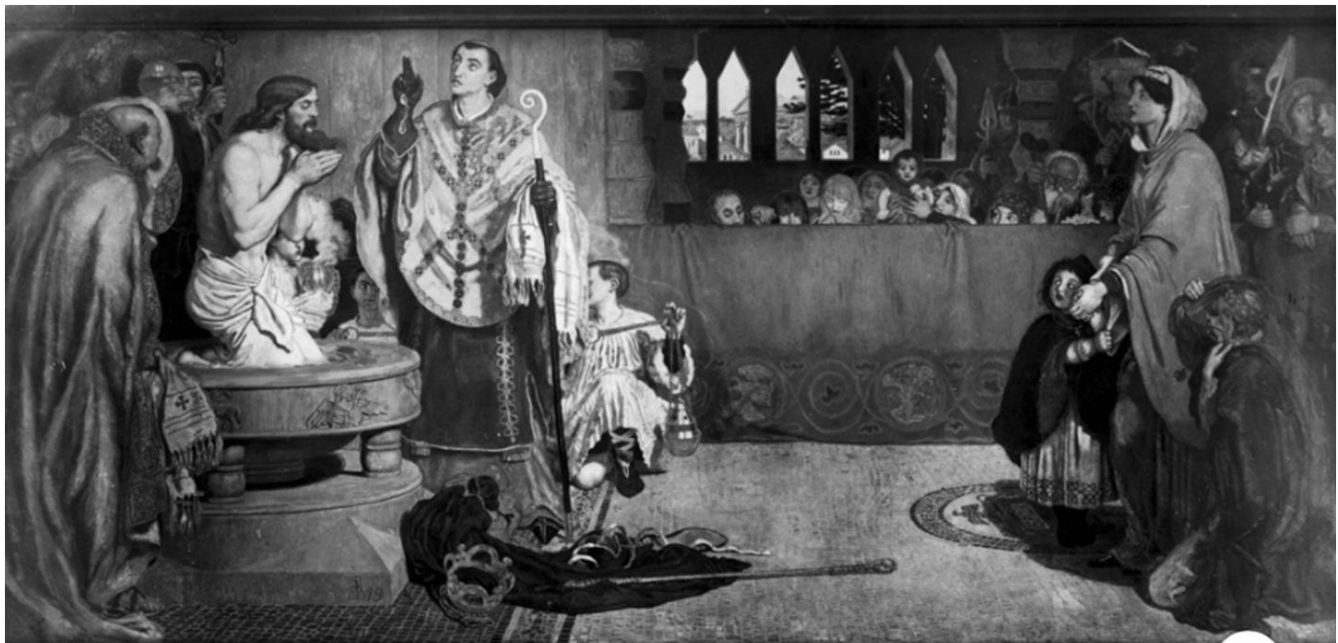
BAUTISMO DE EDWIN