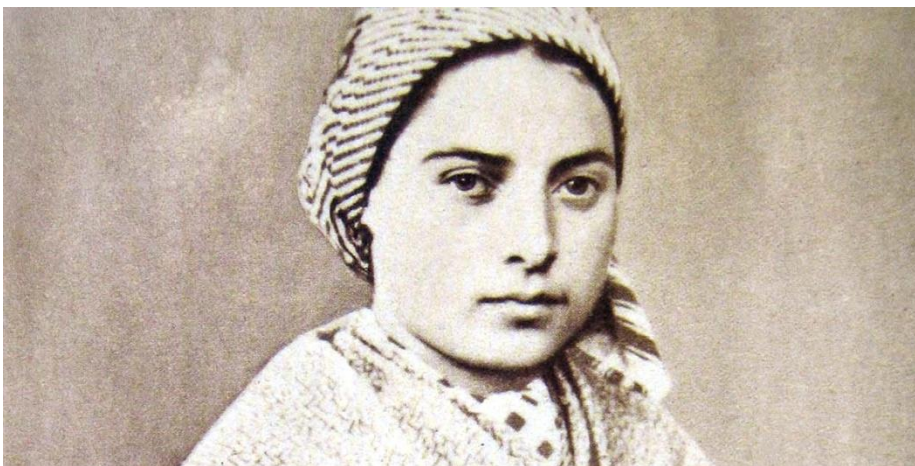
Santa Bernadette Soubirous

“Oh mis queridos feligreses, ¡tratemos de llegar al cielo! Allí veremos a Dios. ¡Qué felices nos sentiremos! Si la parroquia se convierte vamos a ir allí en procesión con el párroco a la cabeza... ¡Tenemos que llegar al cielo!”