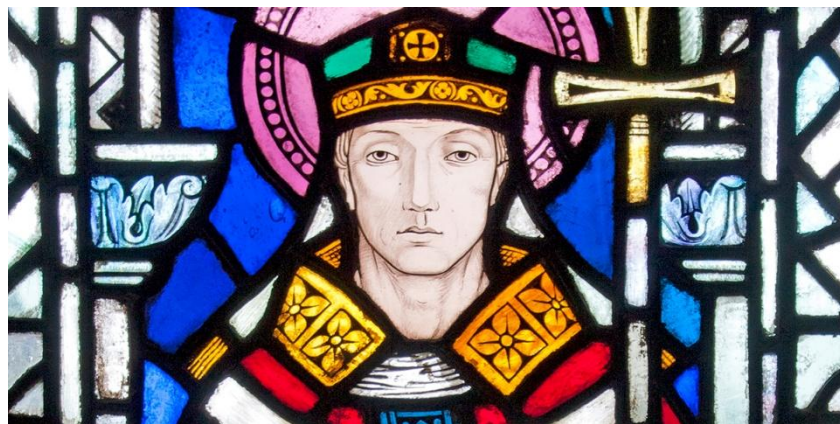
San Anselmo de Canterbury

“Nadie tendrá ningún otro deseo en el cielo que lo que Dios quiere; y el deseo de uno será el deseo de todos; y el deseo de todos y de cada uno de ellos será también el deseo de Dios”.