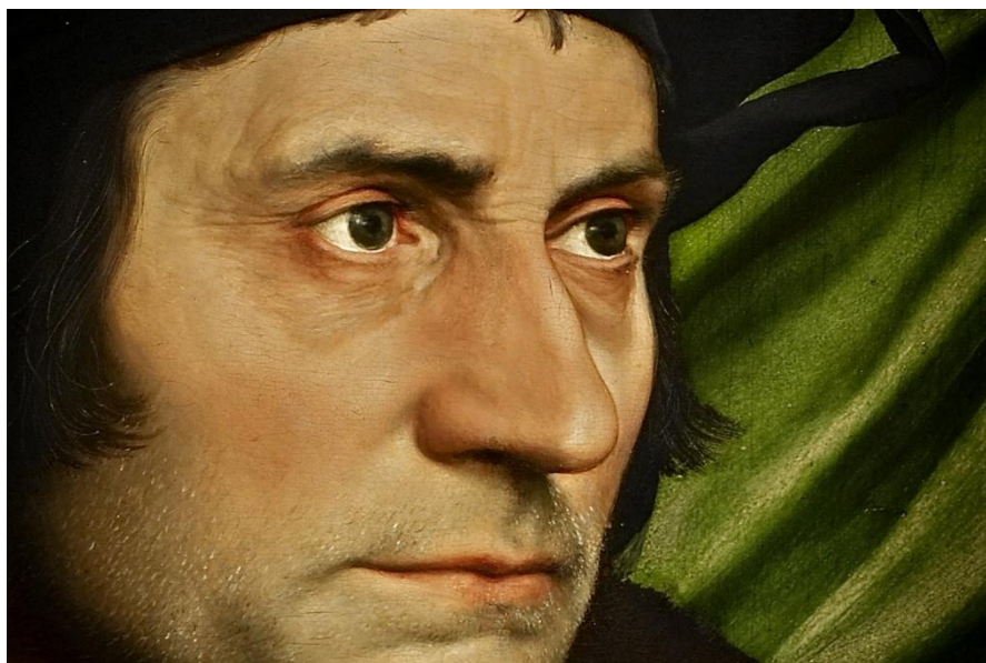
Santo Tomás Moro

“Mi corona en el cielo brillará con inocencia, y sus flores serán radiantes como el sol. Los sacrificios son las flores que Jesús y María eligieron”.