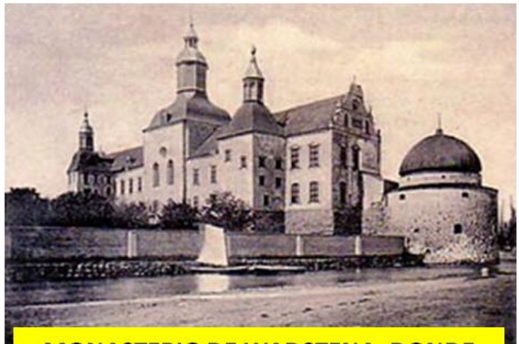
MONASTERIO DE WADSTENA, DONDE SANTA CATALINA FUE ABADESA

Al llegar a su monasterio en Suecia, vio a un obrero caer de un edificio y estrellarse contra el suelo. Las oraciones de Catalina y el contacto de su mano hicieron que el obrero se restableciera al instante.