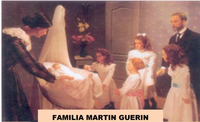
FAMILIA MARTIN GUERIN

https://www.aciprensa.com/recursos/santa-teresita-del-nino-jesus-1619