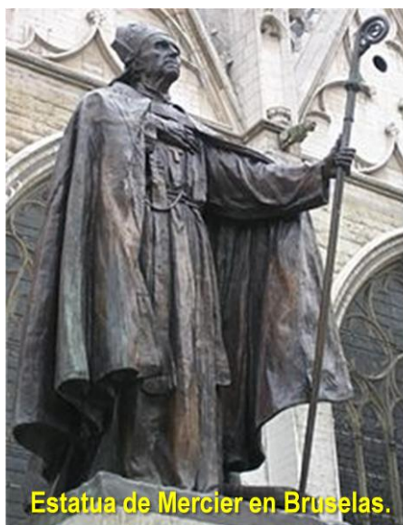
Estatua de Mercier en Bruselas.

En “Los Católicos y la Psicología” dicen sus autores: “Como profesor fue verdaderamente afortunado, no sólo por sus brillantes dotes intelectuales, sino también porque amó su vocación. De hecho, permaneció maestro a través de toda su vida. Sus clases en la Universidad eran bien preparadas, basadas en sus lecturas ininterrumpidas y en sus investigaciones. Se sabía perfectamente en Louvain que él trabajaba hasta las primeras horas de la madrugada y que las luces en sus ventanas eran las últimas en apagarse. Se decía de Mercier que rompía las notas para sus cursos cada año para reescribirlas mejores, y así evitar cursos anticuados. Presentaba sus cursos con entusiasmo y claridad. Sus estudiantes le llamaban el gran simpático”