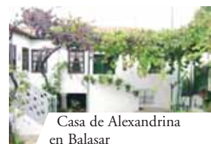
Casa de Alexandrina en Balasar