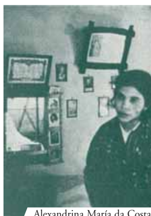
Alexandrina María da Costa