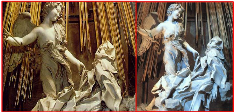
Éxtasis de Santa Teresa de Jesús, de Bernini. Iglesia de Santa Maria della Vittoria

De la cruz dice la Esposa A su Querido Que es una palma preciosa Donde ha subido, Y su fruto le ha sabido A Dios del cielo, Y ella sola es el camino Para el cielo.