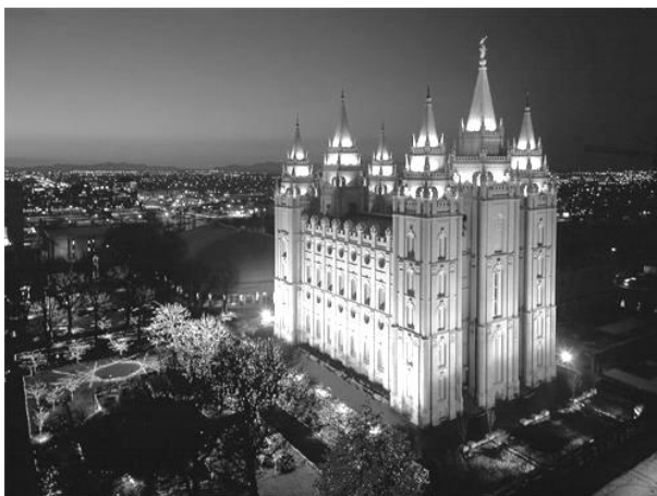
TEMPLO MORMÓN http://historiamormona.com

Fue en el concilio de Trento que se puso el punto sobre las íes para dejar en claro los preceptos católicos.