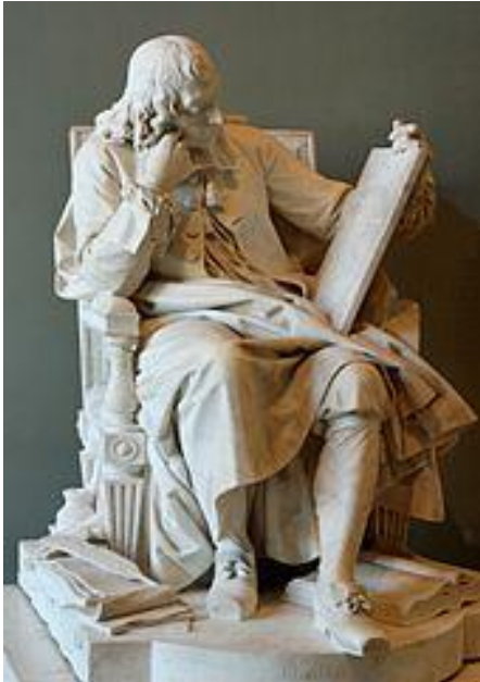
Pascal por Augustin Pajou, 1785, Louvre

Por eso su sobrina, que lo acogió en las últimas semanas de vida y fue su ejecutora testamentaria, atendió a la propuesta de Arnauld y entregó esos preciosos papeles un tanto dispersos para que fueran articulados conforme a lo que Pascal había conversado y convenido con Le Sacy, con Nicole y con Arnauld acerca de la necesidad de formular una robusta defensa racional de la religión cristiana y de la santidad de su causa”.