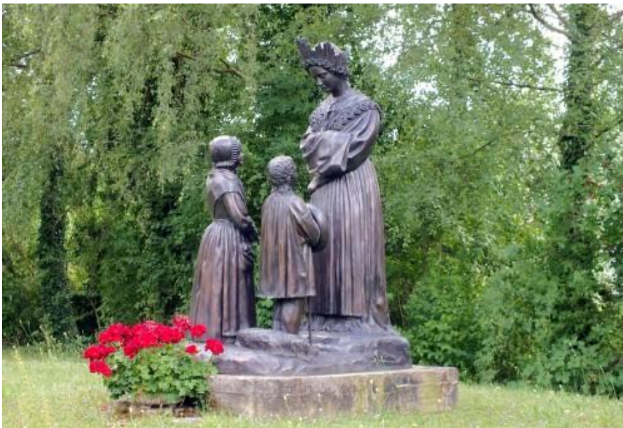
Estatua de Nuestra Señora de La Salette y los dos videntes

“La crisis que la Virgen predijo en La Salette, lo que hará que Roma se convierta en la sede del Anticristo y sea el eclipse de la Iglesia, está profetizado en el Apocalipsis”.