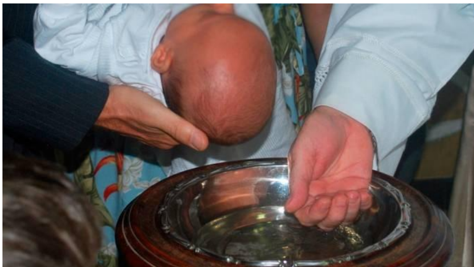
Bautismo (imagen referencial)

Si renuevas tus promesas bautismales durante la Vigilia Pascual de Sábado Santo obtienes indulgencia plenaria.