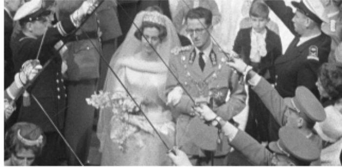
La boda del rey Balduino de Bélgica.

Pero Balduino y Fabiola no pudieron tener hijos, por lo que a la muerte de él lo sucedió en el trono su hermano menor.