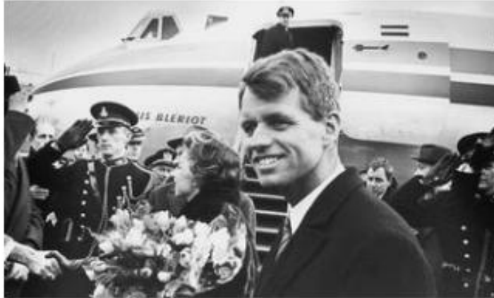
Robert Kennedy.

Modela y remodela este barro como arcilla en manos del alfarero. Dale una forma y después, si quieres, deshazla,