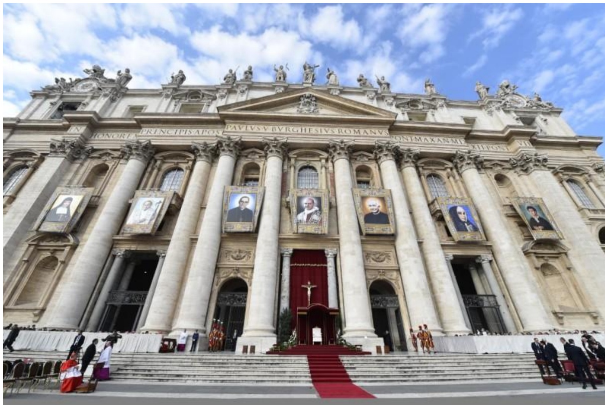
Siete Nueve Santos En La Iglesia