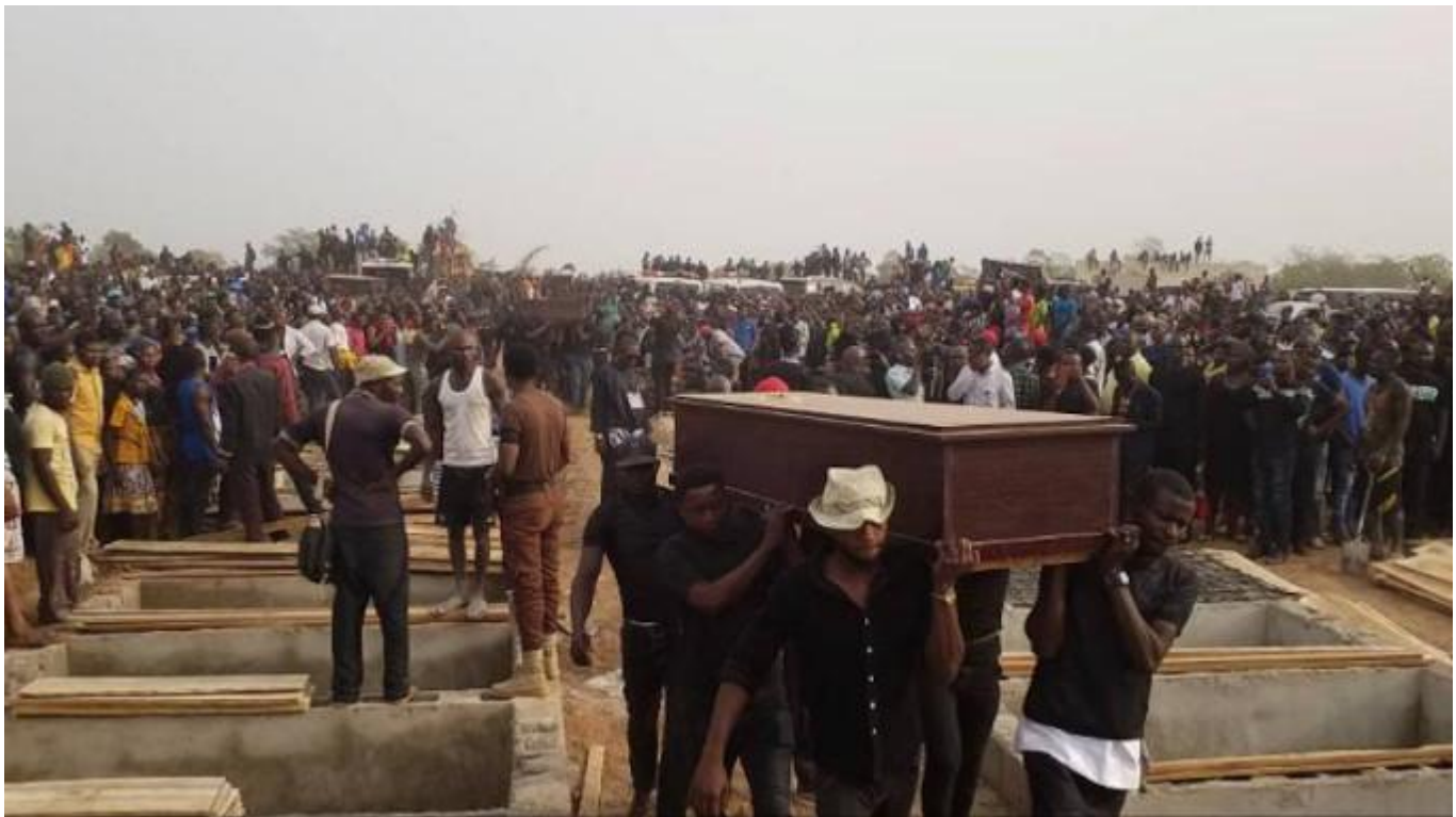
Funeral masivo en la aldea nigeriana de Genabe

https://www.infocatolica.com/?t=noticia&cod=41655