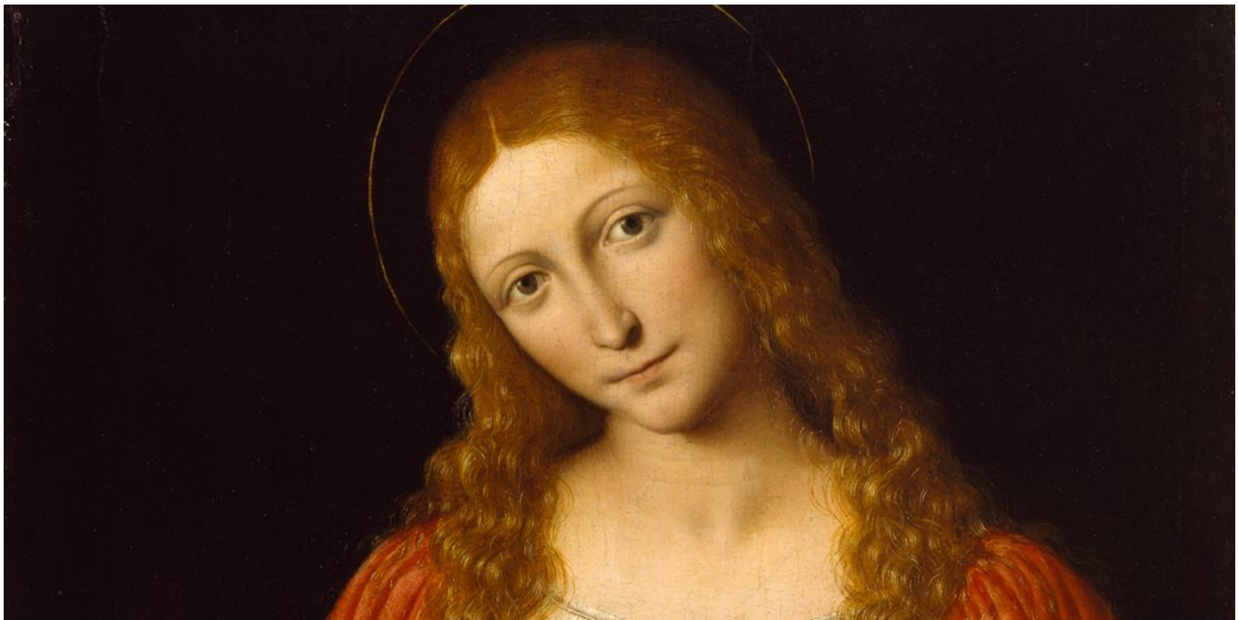
Andrea Solari | Public Domain

A partir de muchas novelas pseudohistóricas y textos gnósticos se vuelve a proponer la versión de una relación «especial» de Jesús con María Magdalena , como si hubiera sido su esposa o su amante.