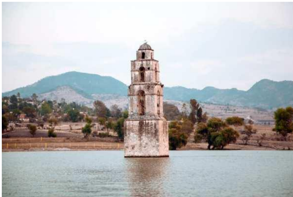
Iglesia de San Luis de las Peras– Estado de México

¿Te imaginas encontrarte con una iglesia de la época colonial sumergida bajo el agua? Te tenemos la noticia de que esto es más común de lo que crees en nuestro país. En México , existen una buena cantidad de templos católicos sumergidos como consecuencia de la construcción de presas . Afortunadamente, muchos de estos monumentos aún se mantienen de pie, y aunque algunos no se pueden ver durante todo el año, sí existe la posibilidad de conocerlos e incluso tomarte una fotografía muy diferente a cualquier otra que hayas visto. Aquí te compartimos algunos de los templos sumergidos en México que pocos conocen y son un espectáculo.